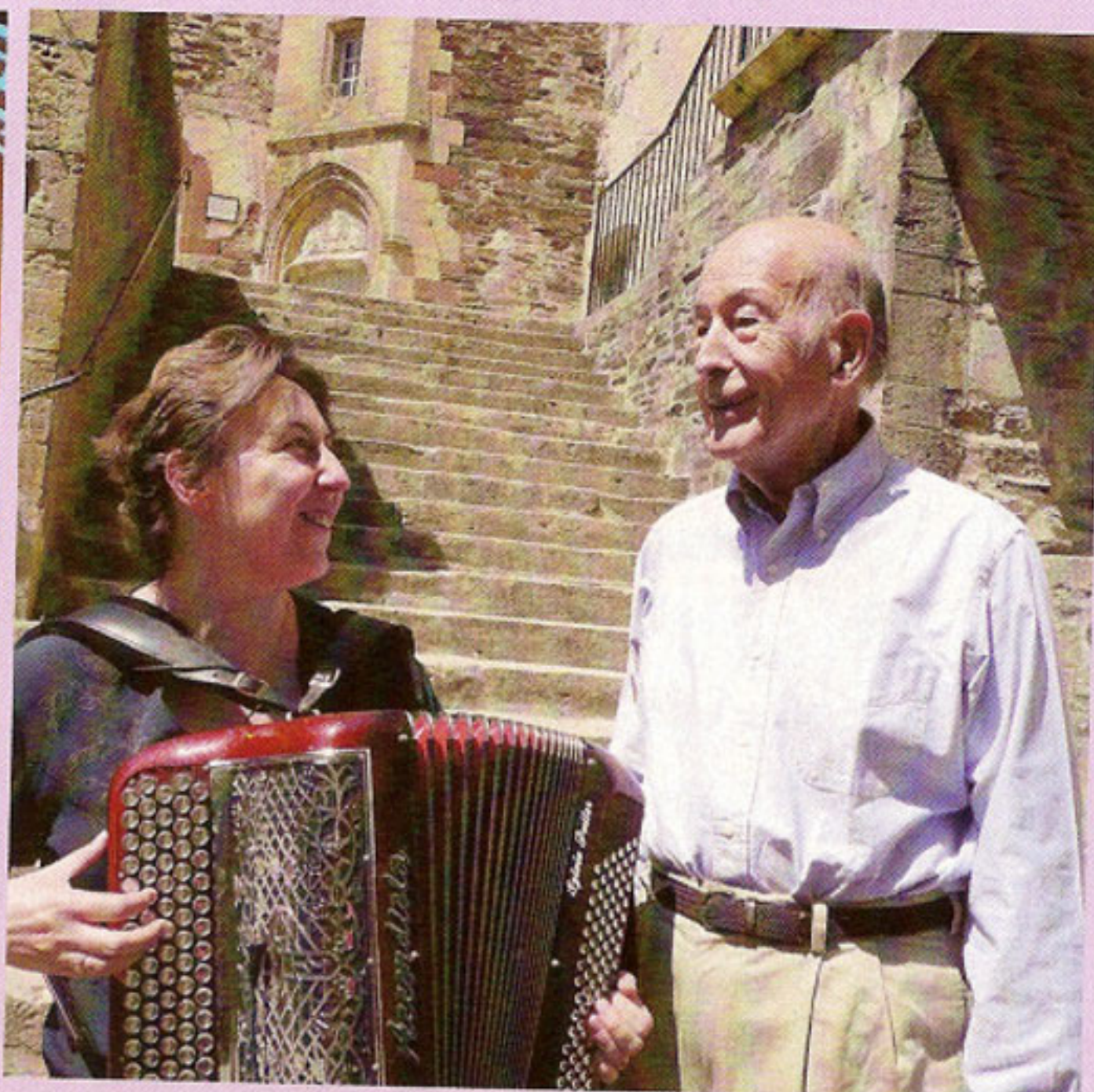
Jouant pour Valéry Giscard d'Estaing.