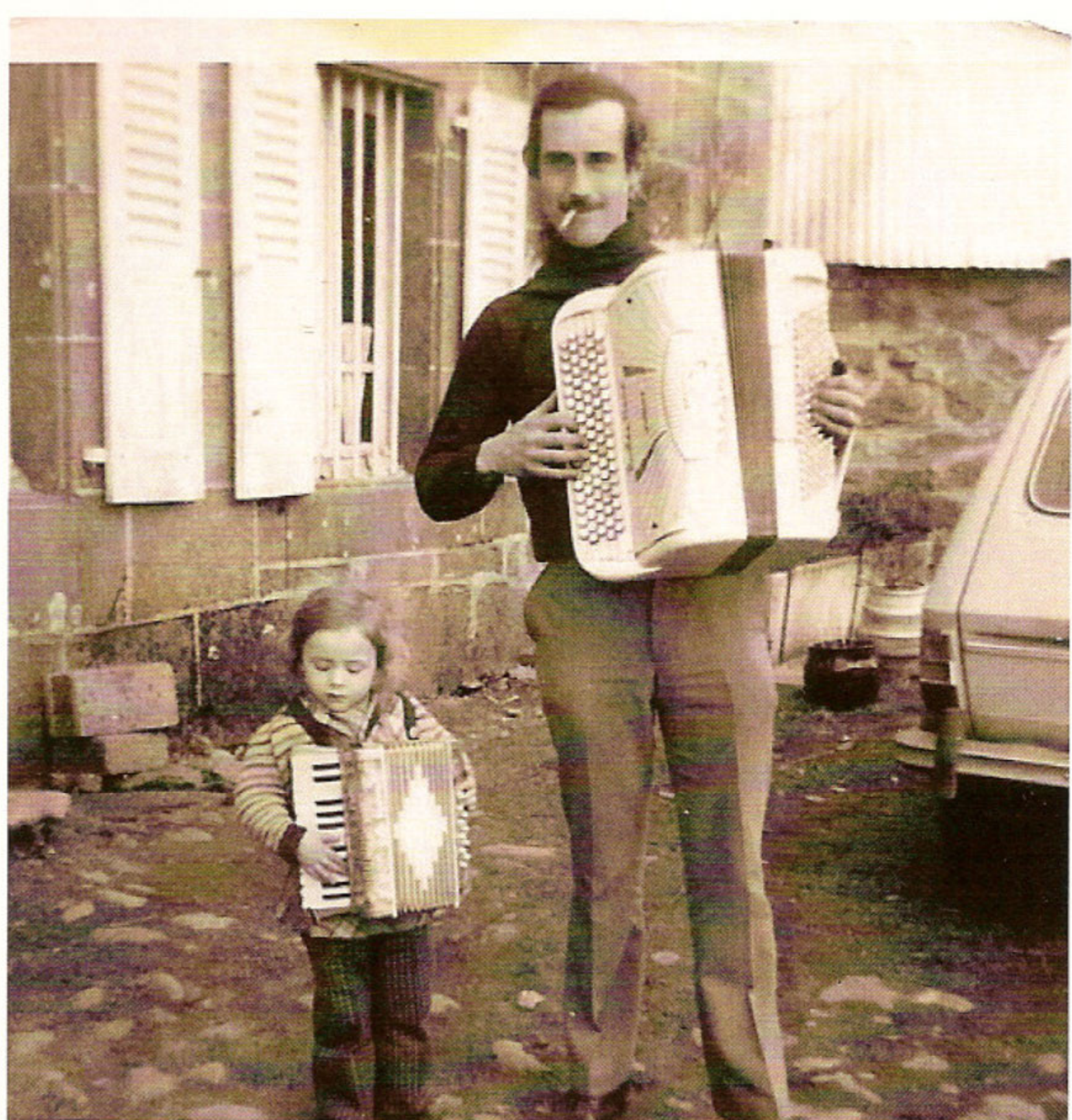
29 mars 1975, avec son père.

Au fait, chez elle, elle écoute quoi ? Du classique, notamment Bach, de l'opérette, Luis Mariano, Tino Rossi, Dalida, dont elle connaît tous les répertoires par cœur, les musiques du monde. Quant à ses loisirs, ils sont réduits à leur plus simple expression, vu son emploi du temps surchargé. Sinon, elle privilégie les voyages, la famille... Et une bonne table. Enfin, avant de "jauger" notre invitée-phare de ce début d'année, reconnaissons-lui une sacrée performance : elle a converti l'Olympia à l'accordéon, plus d'un demi-siècle après le roi Verchu. Chapeau l'artiste.