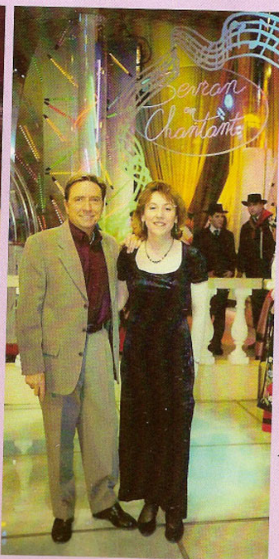
Sur le plateau de "Sevran en chantant", émission animée par Pascal Sevran.