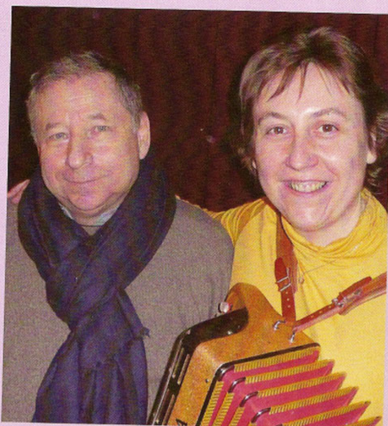
Avec Jean Todt.